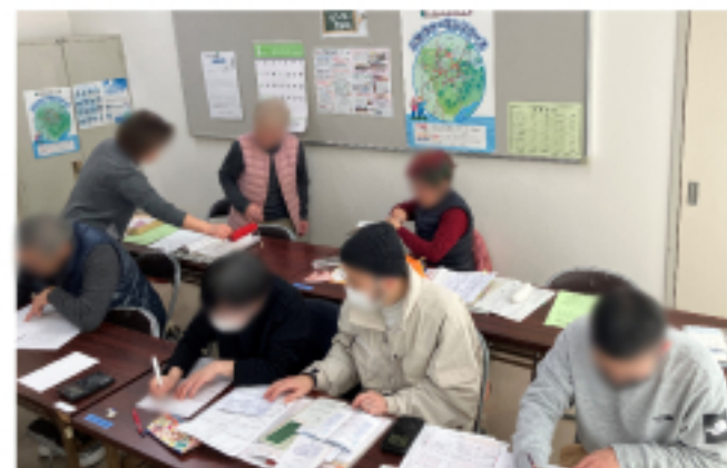
八児市民センター 班会の様子

計算がひと段落したところで、共済会と婦人部への加入の呼びかけを行い、役員さんからも「婦人部はひと月100円だから、自分が参加できなくても、応援の気持ちで入って」と呼びかけ、部員を拡大することが出来ました。