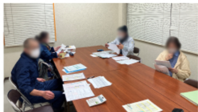
中尾市民センター 班会の様子

昨年まで所得税が発生したAさんは今年も税金が出るだろうと申告書の作成をはじめると、基礎控除の引き上げにより所得税が出ませんでした。Aさんは「今年は自分でやってみようと思っていたが、班会議に来て良かった」と申告書の作成を終えて安心した様子でした。