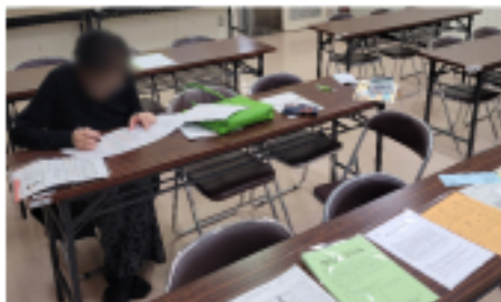
黒崎市民センター 班会の様子