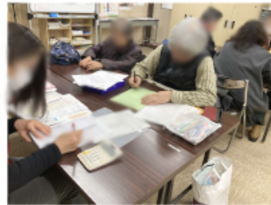
署名に協力する陣原支部の会員さん(中央)

建設業のAさんは「弥生会計 で毎年していますが、問いには い・いいえで答えていくと申告 書が出来るんですが、ちよつと の事で数字が反映されなかつた りして、夜中の3時にしていた