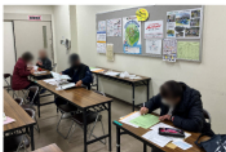
八尾市民センター 班会の様子