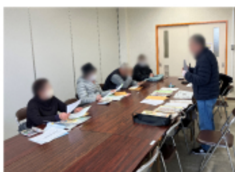
中尾市民センター 班会の様子