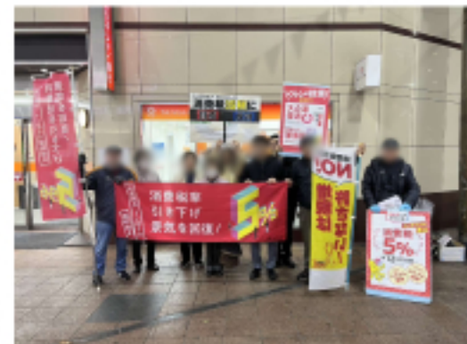
消費税引き下げ宣伝に参加した団体の皆さん

い込みましょう」「政府は、インボイス制度実施による消費税負担軽減措置を改悪しようとしています。インボイス制度は廃止させましょう」と訴えました。シールアンケートは「賛成」