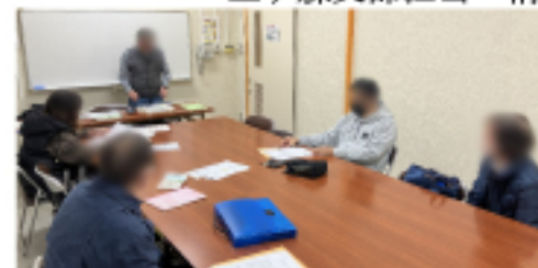
中尾市民センター 班会の様子