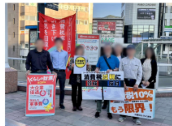
消費税引き下げ宣伝に参加した役員と事務局

「消費税減税」「インボイス廃止」のプラカードを掲げ、チラシ30枚を手渡ししながら、消費税減税に「賛成」か「反対」かのシールアンケートを行いました。