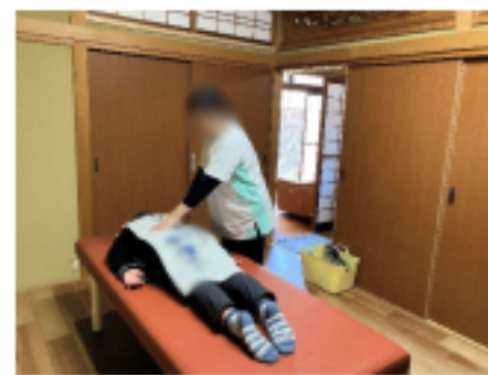
自宅を改装し、施術可能に

市内の方で国民健康保険、後期高齢者医療保険に加入の方は、市からの補助があるため施術を受けやすくなっています。補助を受けるには申請手続きが必要ですが、お体のお悩みがある方は、まずはお電話いただけたらと思います。