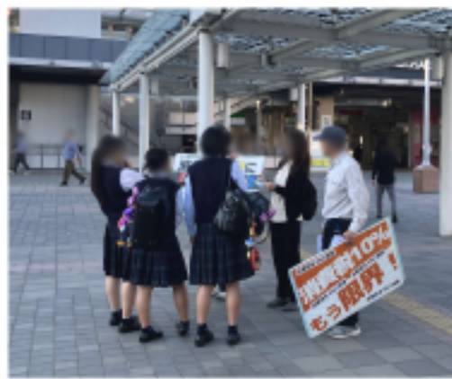
消費税について女子高生たちと対話

2025年度の企業倒産は、1万505件と4年連続で増加し、12年ぶりの高水準となりました。そのすべてが中小企業というのは初めてで、負債1億円未満の構成比が76.7%に及ぶなど、小・零細規模の倒産が際立っています。統計比較が可能な直近30年間の中で、中小・零細規模かつ消費税の倒産が際立っている異常事態です。 3. 13重税反対全国統一行動 八幡戸畑地区実行委員会は、定例の消費税引き下げ街頭宣伝行動を5月13日に黒崎駅前で行い、八幡・八幡西民商の役員・事務局の8人が参加しました。