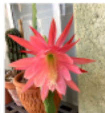
クジャクサポテンの仲間グッカビジンは一日だけ

今週のお花 クジャクサポテンの花言葉は「幸せをつかむ」「あでやかな美人」「はかない美」です。クジャクサポテンの仲間グッカビジンは一日だけ花をつけます。その様子にちなんだ花言葉がクジャクサポテンにもつけられました。風水において強力な「魔除け・邪気払い」効果を持つとされます。トゲが少ない種類でも、鋭い葉や成長する姿が悪い気を断ち切り、良い気を引き寄せます。